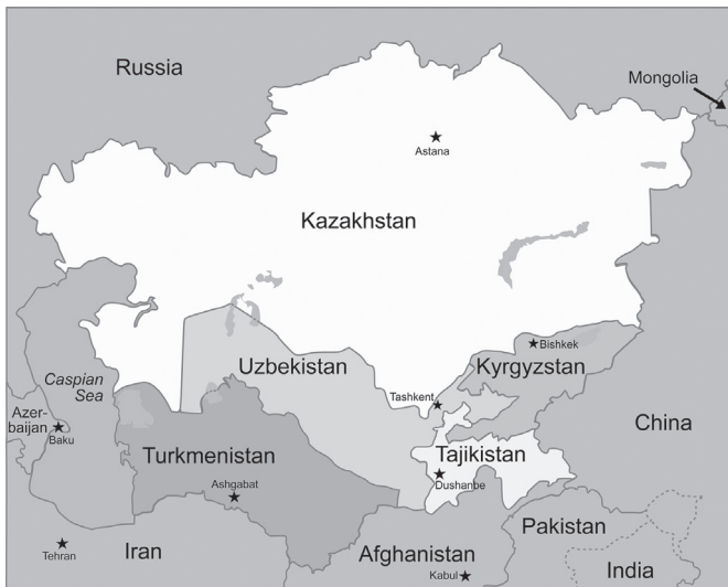
Slika br. 3 – Prikaz 5 zemalja koje čine Centralnu Aziju 2 (slika preuzeta sa politicke mape drzava Centralne aziije https://commons.wikimedia.org/wiki/File:Central_Asia_-_political_map_2008.svg )

politiku izbegavanja konflikata. Uspeo je da napravi i naslednicima ostavi stabilno političko okruženje, skoro bez etničkih netrpeljivosti i sukoba unutar države. Njegovom zaslugom, slično Petru Velikom, grad Astana je postao glavni grad Kazahstana umesto Alma Ate.